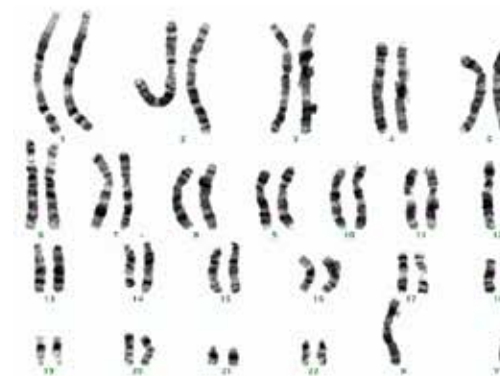
Prawidłowy kariotyp męski